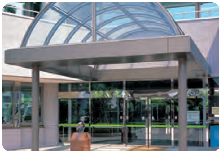
BK-3 防音ドア (ステンレス)