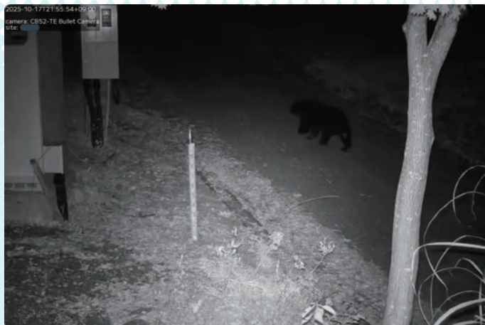
ツキノワグマを検知した際のアーカイブ映像。夜間でも鮮明に様子を 確認できる